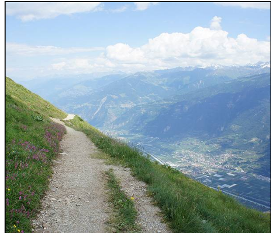
Vue plongeante sur la vallée du Rhône