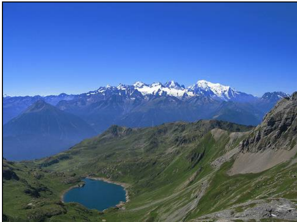
Vue grandiose sur le massif du Mont-Blanc et les lacs de Fully

Le Grand Chavalard est une montagne qui domine la plaine du Rhône et qui est située à l'ouest d'Ovronnaz.